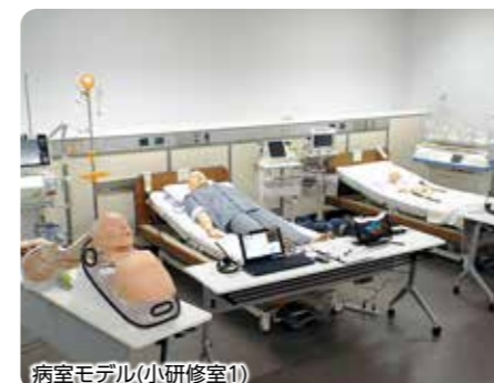
病室モデル(小研修室1)