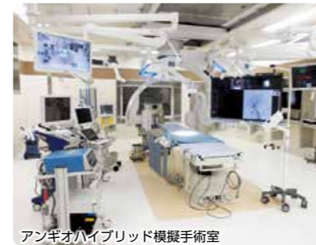
アンギオハイブリッド模擬手術室