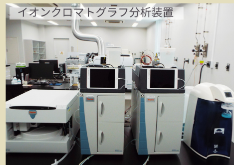
イオンクロマトグラフ分析装置