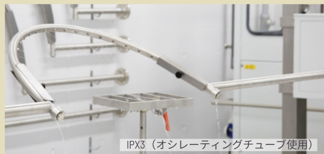
IPX3 (オシレーティングチューブ使用)