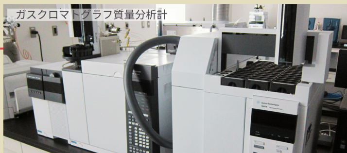
ガスクロマトグラフ質量分析計

※RoHS指令対象物質 (10項目) に関してISO/IEC 17025の試験所認定を受けています。材質によって対象とならない場合がありますのでお問い合わせください。