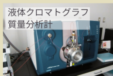
液体クロマトグラフ質量分析計