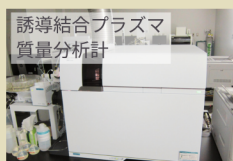
誘導結合プラズマ質量分析計