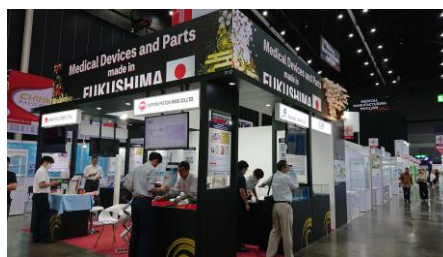
MEDICAL FAIR THAILAND 2023