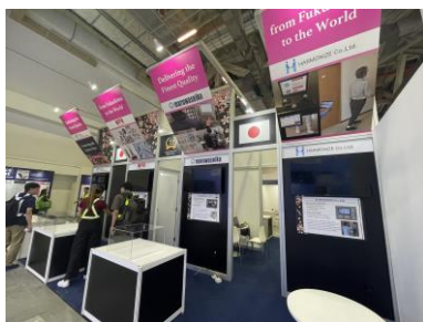
MEDICAL FAIR ASIA 2024